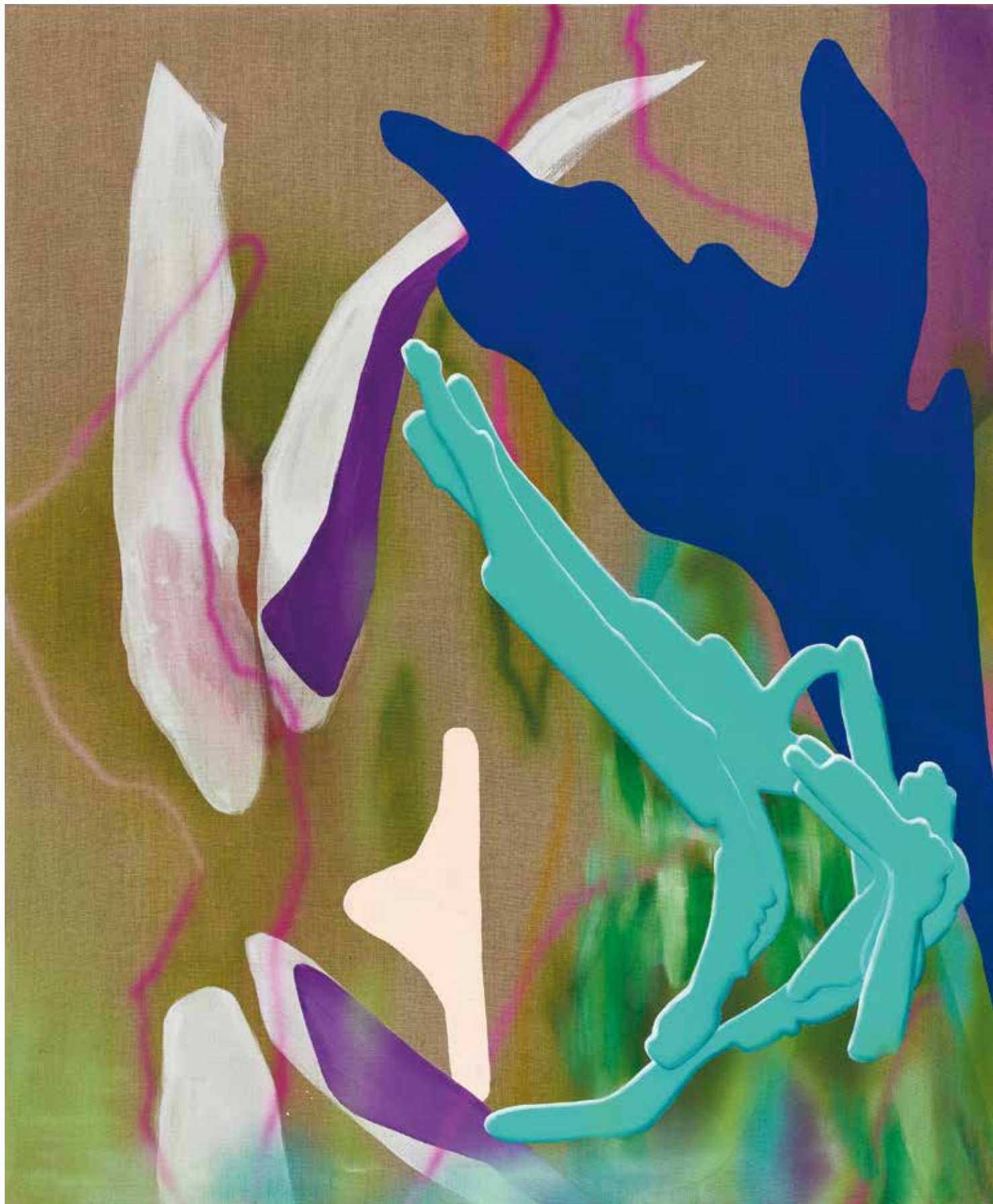
(oben | top) SPIONAGE, 2023 Acryl, Airbrush auf Leinwand | acrylics, airbrush on canvas, 170 x 140 cm.