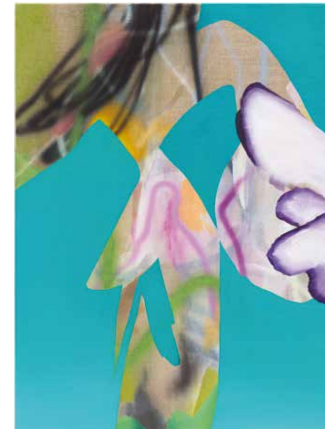
SPRINGINKERL 2, 2023 Acryl, Airbrush, Leinwand | acrylics, airbrush, canvas, 60 x 50 cm.