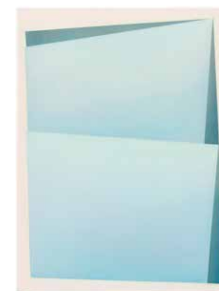
PYRAMIDE, 2021 Öl auf Leinwand / Oil on Canvas, 80 x 60 cm FLÄCHENTAUCHER, 2019 Öl auf Leinwand / Oil on Canvas, 220 x 160 cm REGISTRIERT I, 2021 Öl auf Leinwand / Oil on Canvas, 80 x 60 cm