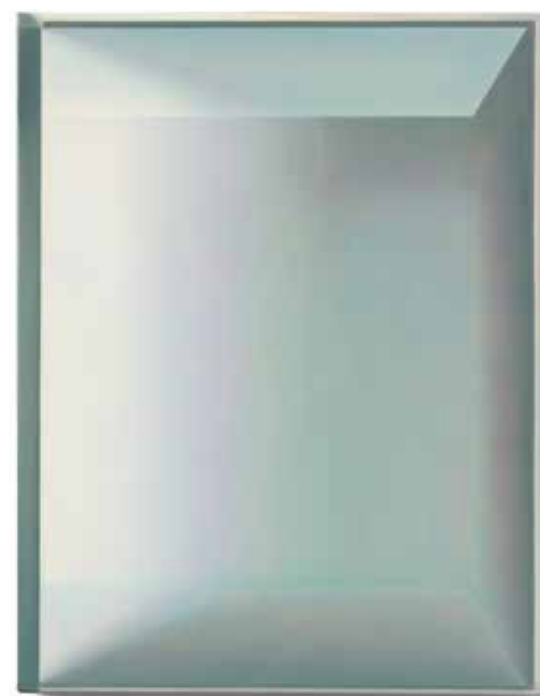
DAZWISCHEN, 2021 Öl auf Leinwand / Oil on Canvas, 40 x 40 cm GRÜNER RAUM, 2021 Öl auf Leinwand / Oil on Canvas, 70 x 90 cm