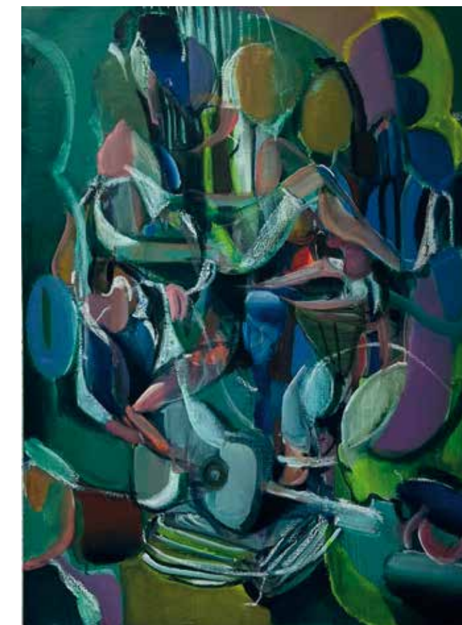
(unten | below) RINGELMANN, 2025 Öl auf Leinwand | oil on canvas, 70 x 50 cm