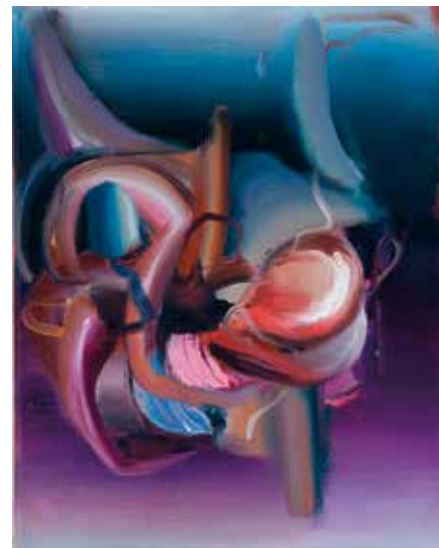
(oben | top) GANG, 2024 Öl auf Leinen | oil on linen, 70 x 50 cm