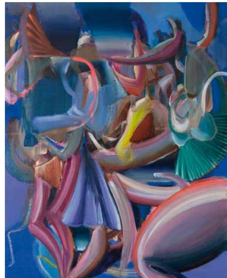
(unten | below) MILGRAM, 2025 Öl auf Leinwand | oil on canvas, 50 x 40 cm