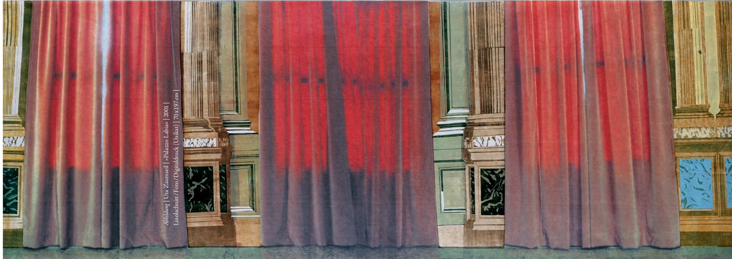
Abbildung | Uta Zaumseil | »Palazzo Labia« | 2001 | Linschnitt/Foto/Digitaldruck (Unikat) | 70x197 cm |

Gefördert durch die Kulturstiftung des Freistaates Sachsen